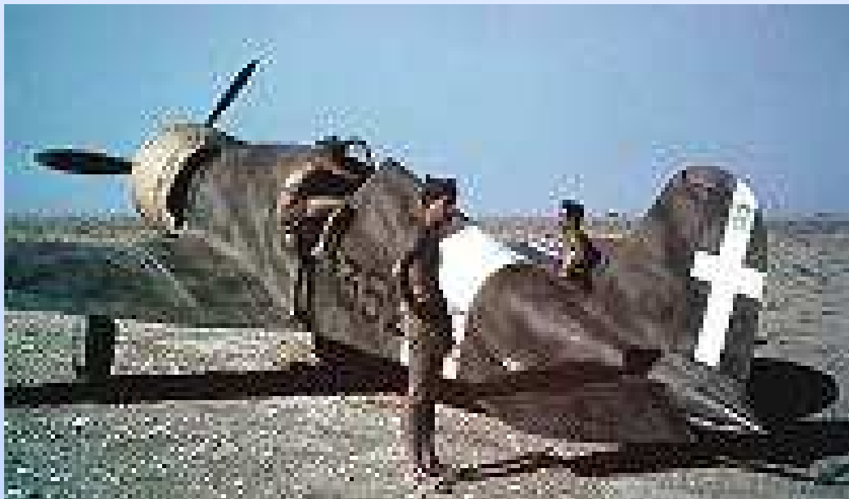
Fiat G50 352 ^ Sq. 20° Gruppo C.T. Martuba Libia 1940

Un salto nella storia in onore dei tanti aviatori che con sacrificio, a volte estremo, contribuirono alla difesa del paese. E' oramai prassi che l'ultima pagina del ns. bollettino ci riporterà indietro nel tempo, attraverso la riproposizione delle araldiche che contraddistinsero Stormi, Squadriglie e Gruppi di volo, della nostra Aeronautica Militare